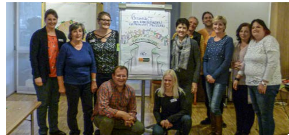
Text: Redaktion PURPUR

Vielen Dank an die Firma Motio Chiemgau und die DAK Gesundheit für die Unterstützung bei der Umsetzung des Projektes!