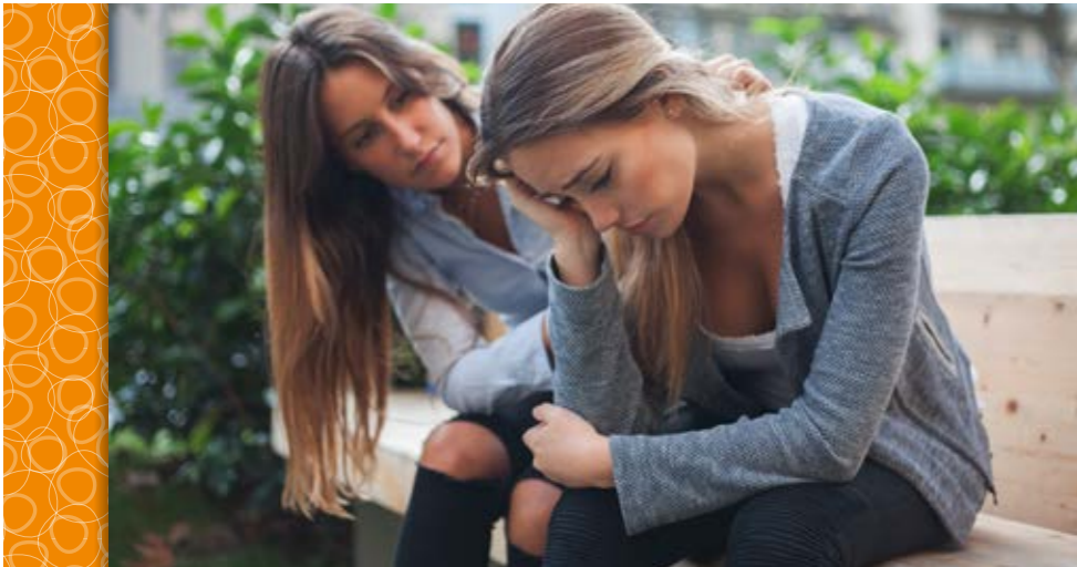
Text: Redaktion PURPUR

Manchmal muss man aber auch einfach feststellen, dass einem eine bestimmte Freundschaft gar nicht gut tut. Es gibt sogenannte „Freunde“, die deine Geheimnisse einfach weitertragen, hinter deinem Rücken schlecht von dir reden, dich gerne mal respektlos behandeln oder dich insbesondere vor anderen Menschen schlecht dastehen lassen. Andere erzählen immer nur von sich, benutzen dich wie einen „Abfalleimer“ indem sie all ihre Probleme bei dir abladen. Wenn man sie selbst braucht, haben sie keine Zeit oder können/wollen nicht zuhören und Verständnis für deine Situation aufbringen. Oft dauert es, bis man merkt, dass man sich in Gegenwart dieser Person verstellen muss, sich nicht wohl fühlt und am liebsten gar nichts von sich mehr preisgeben möchte. Dann ist es am besten, diese Freundschaft zu beenden. Denn so gut einem eine gute Freundschaft tun kann, so kann eine schlechte einem auch schaden und Kraft kosten.