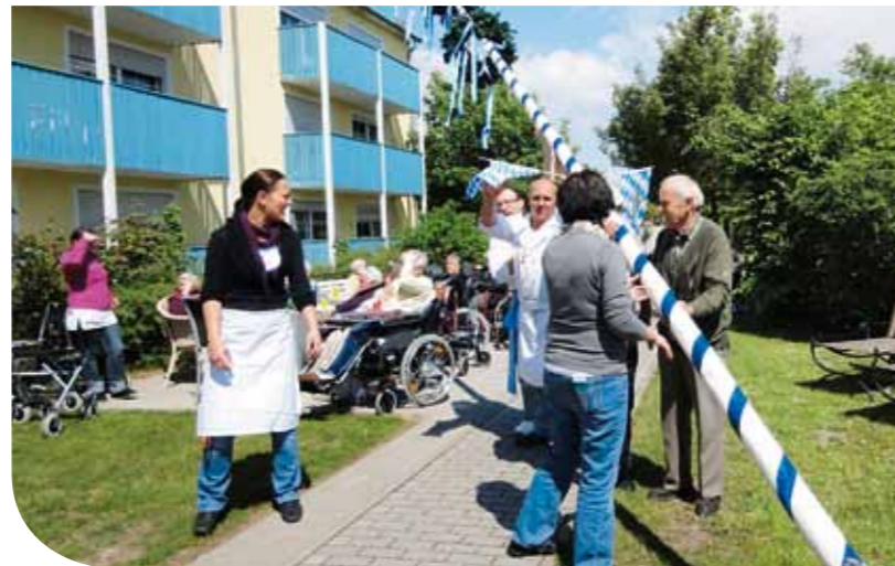
Alle packen mit an, damit der Baum auch schön gerade steht

Am 04. Mai 2011 feierte das PUR VITAL Alten- und Therapiezentrum in Straubing sein schon traditionelles Maibaumfest mit den Bewohnern, Angehörigen und Freunden des Hauses. Eingeleitet wird dieses immer mit dem Aufstellen des Maibaumes.