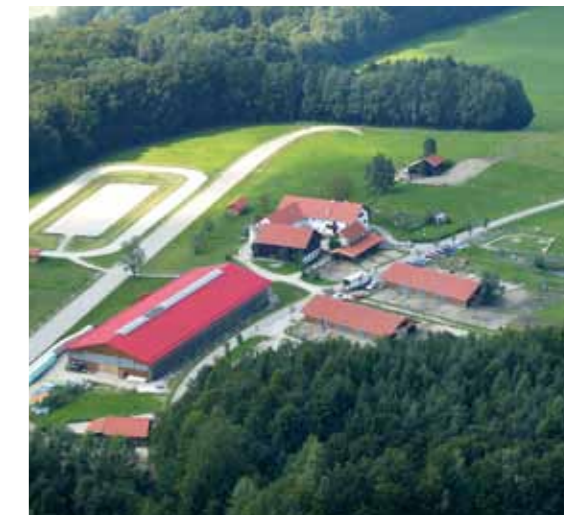
Der Austragungsort - Reithof Piber, St. Radegund