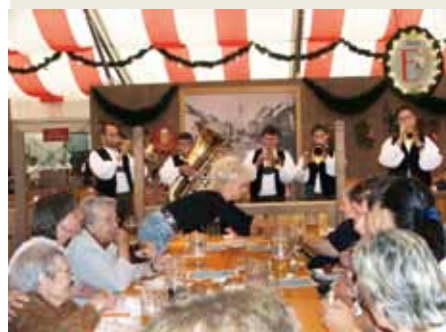
Bewohner des PUR VITAL in Straubing genießen bayerische Gemütlichkeit

Das Gäubodenvolksfest in Straubing ist das drittgrößte Volksfest in Bayern. Seinen Anfang hat es im Jahre 1812 als landwirtschaftli-