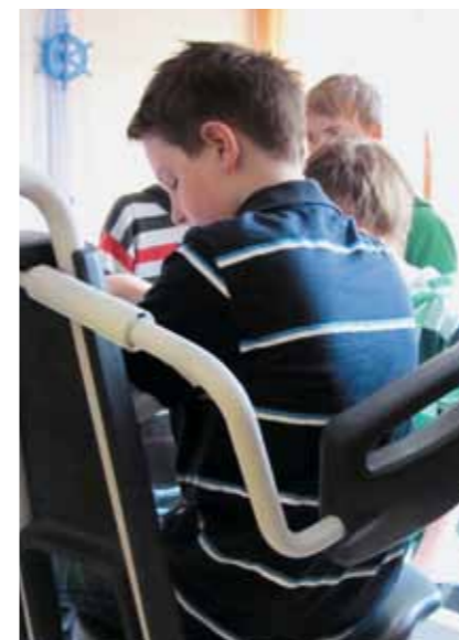
Bitte einmal nach oben und dann wieder runter - Badewannenlifter im Test