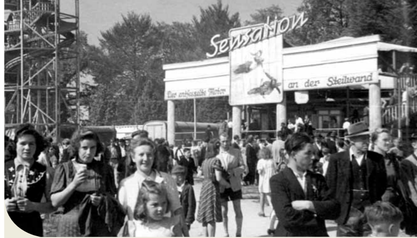
Rosenheimer Herbstfest in seinen Anfangszeiten