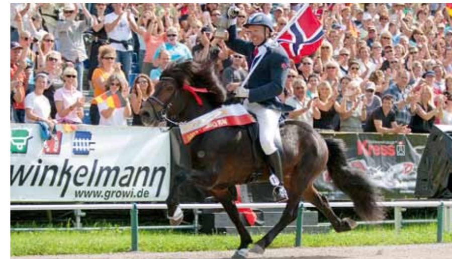
Stian Pederson (Norwegen) - amtierender Weltmeister F1 Fünfgang