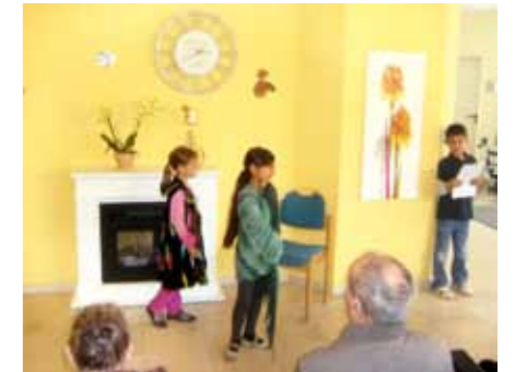
Applaus für so eine gelungene Aufführung!