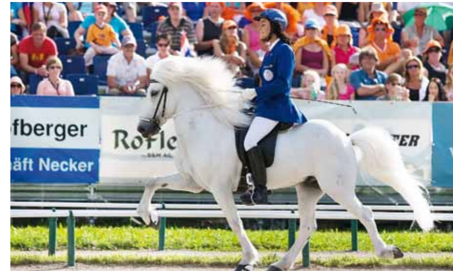
Runa Einarsdottir-Zingsheim (Island) - amtierende Weltmeisterin in der Fünfgangkombination

Temperamentvoll und dabei einen guten Charakter