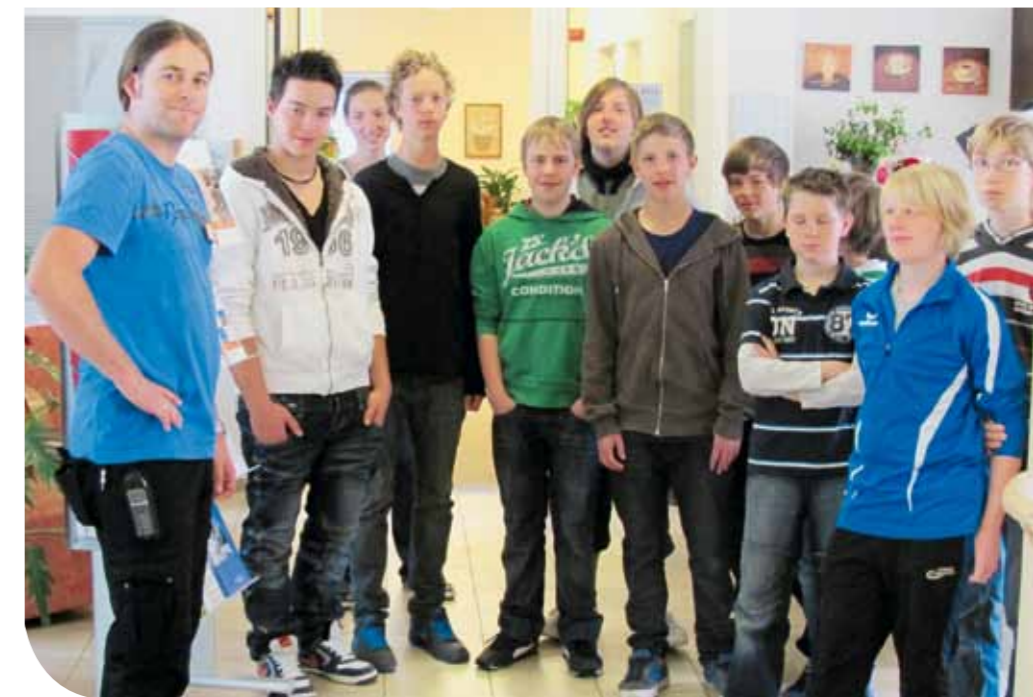
9 Buben besichtigten das PUR VITAL Zentrum für Senioren in Trostberg